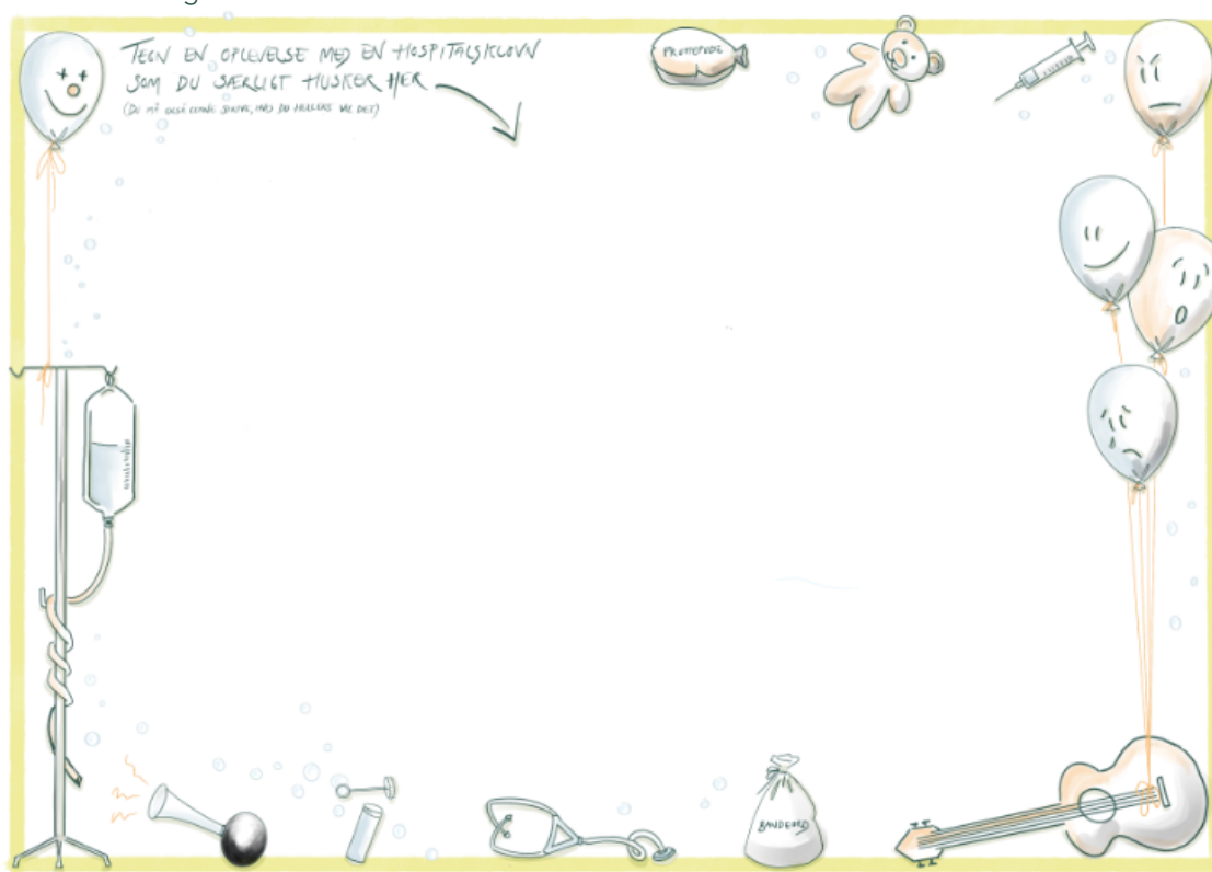
Illustration: Tegneskabelon til interview med børn

Med afsæt i børnenes tegninger blev de interviewet om deres oplevelser med klovnene, og hvilken forskel klovnene gør for dem. Der var også børn, der ikke tegnede, men som blev interviewet om de observationer, vi havde været en del af. På Himmelev Behandlingshjem og Dagtilbud var det ikke muligt at interviewe børnene om deres tegninger, da mange af børnene ikke har - eller kun har et meget begrænset - sprog. Ligeledes var det ikke muligt at interviewe forældrene, da de ikke er tilstede i dagtilbuddet, som SUS besøgte.