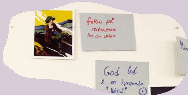
Billede udvalgt af unge på workshop for at illustrere vigtigheden af at fokusere på motivation hos den enkelte.

”Jeg ved, jeg er kreativ. Jeg ved, jeg er flittig. Jeg ved, jeg er god til eventkoordinering, til at tegne, til at producere film. Det anede jeg ikke, før jeg startede her.” Ung fra Aspiranterne