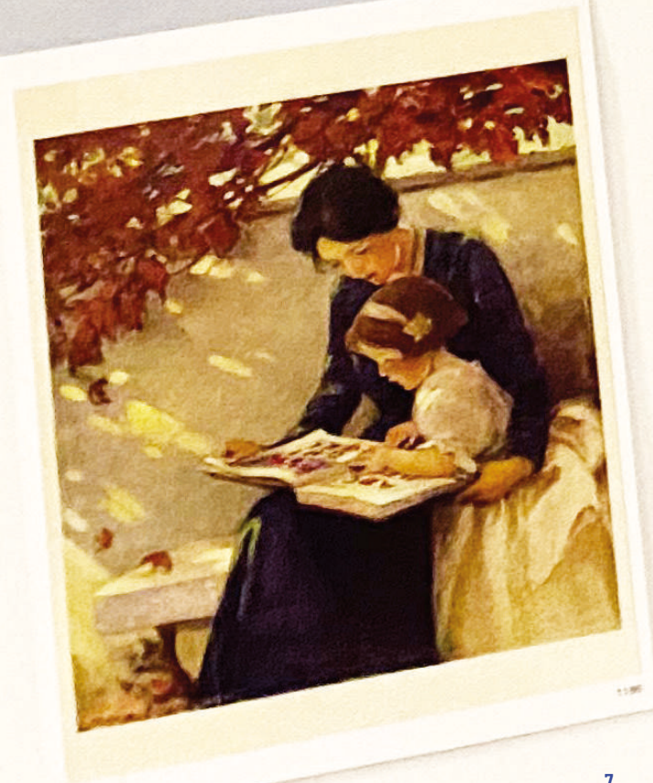
Billede udvalgt af unge på workshop for at illustrere vigtigheden af at fagpersoner lytter til den enkelte